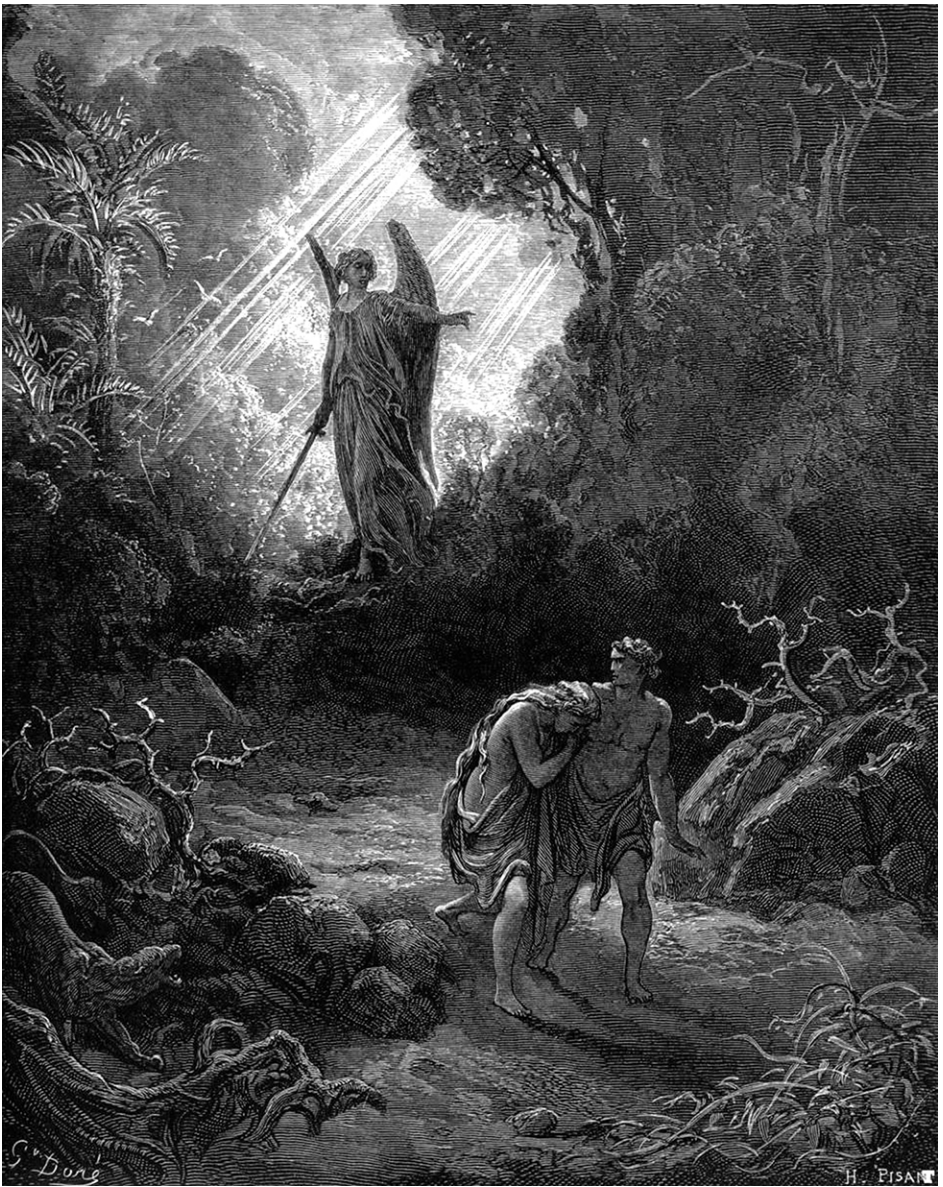
Baada ya kumfukuzia mbali Adamu, Mungu akaweka makerubi mashariki ya Bustani ya Edeni, pamoja na upanga wa moto ukimulika huku na huko kulinda njia ya kuuendea mti wa uzima. Mwanzo 3:24