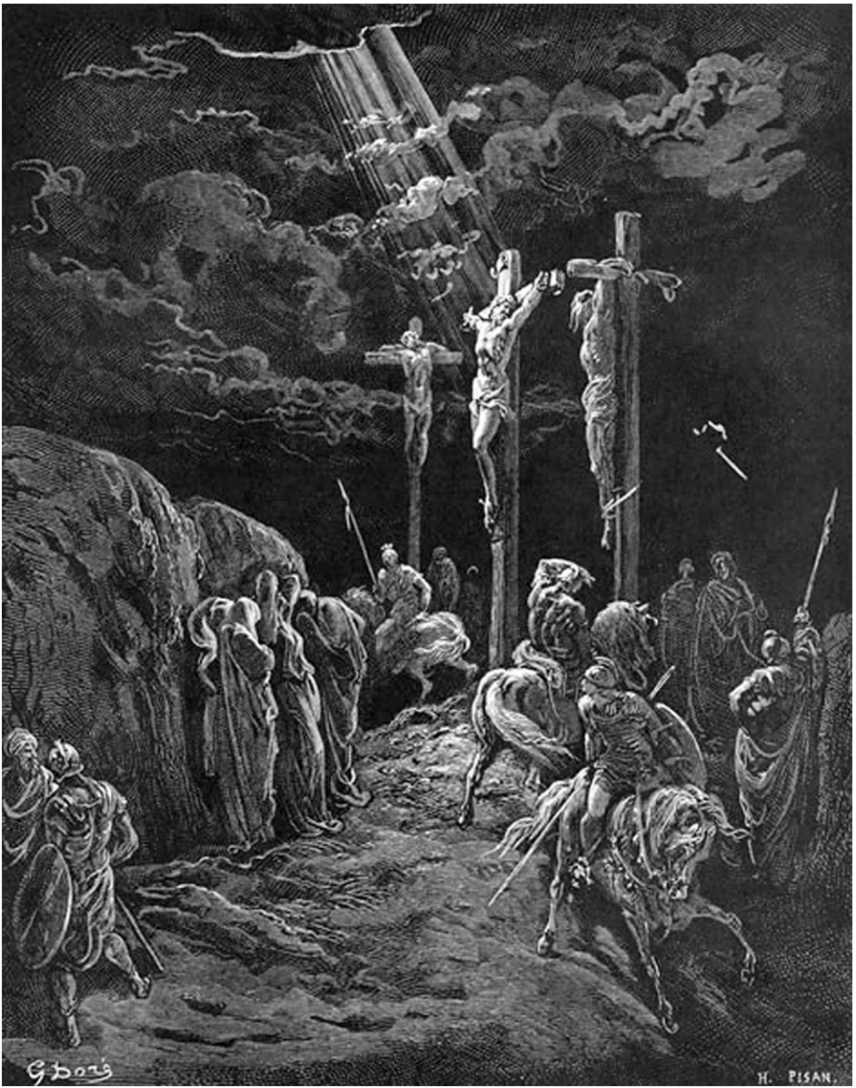
ตทา ยีศรกลยต, เห ปิตเรตานุ กุขมสว ยต เอเต ยค กรम्म กรวาวนติ ตน น วิฑู ; ปศุจาดเต คฤทิกปาต กฤตวา ตสย วสตราณิ วิภชชคฤหุ ๔ ลูก : 23:34