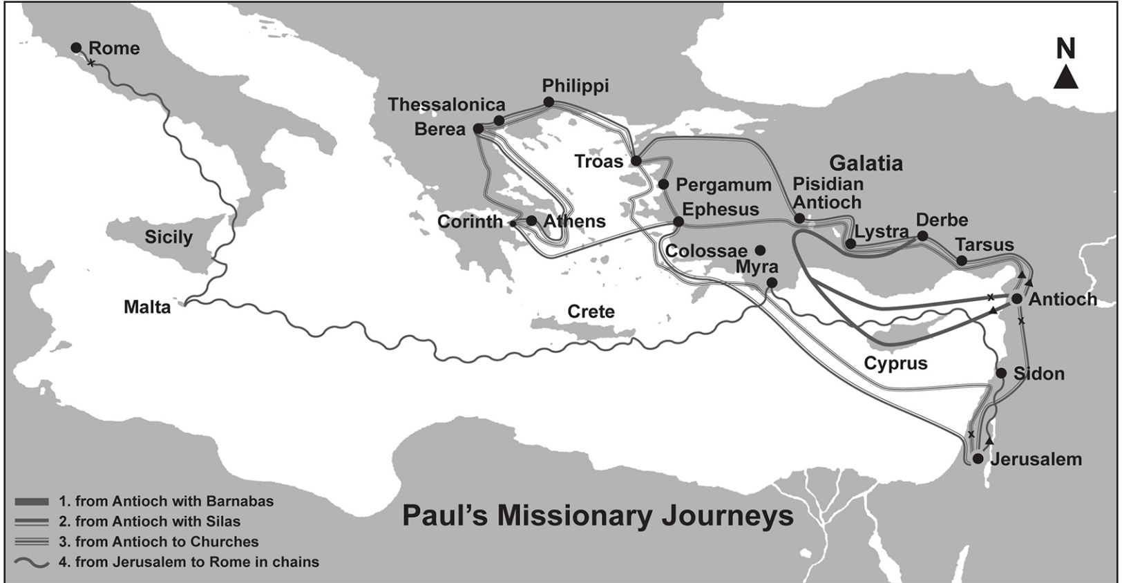
Paulus, een dienstknecht van Jezus Christus, een geroepen apostel, afgezondert tot het Evangelie van God, - Romeinen 1:1