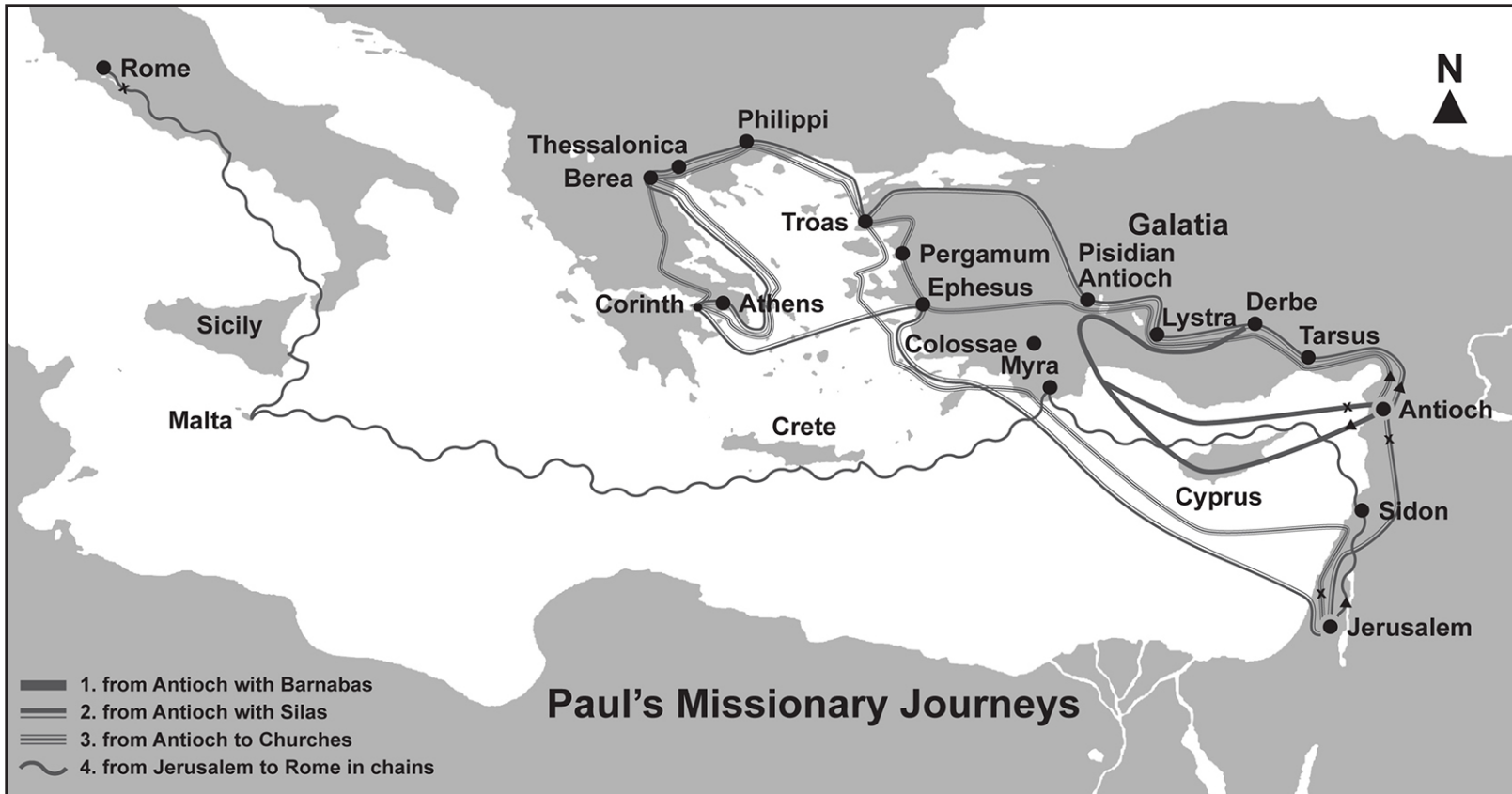
Paulus, Jesu Kristi Tjener, Apostel ifølge Kald, udtagen til at forkynde Guds Evangelium, - Romerne 1:1